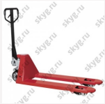
Гидравлическая тележка OXLIFT AC 25