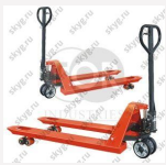
Тележка гидравлическая TOR CBY-DFR 2500 (резиновое колесо)