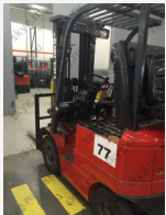
Вилочный электропогрузчик Heli CPD15 Б/У