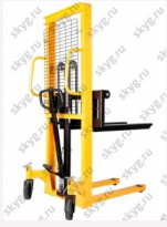
Ручной гидравлический штабелер MS 1516