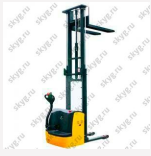
Штабелер самоходный Ningbo Ryu (Xilin) CDDR 1030 - III