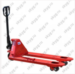
Гидравлическая тележка OX25-PU115 OXLIFT 2500 кг