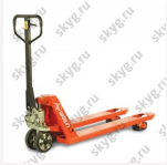
Гидравлическая тележка WARUN HT-PU/Profi-PU